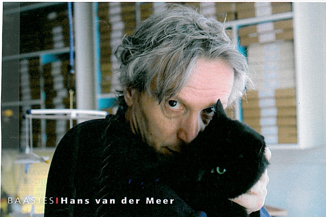
BAASJES | Hans van der Meer